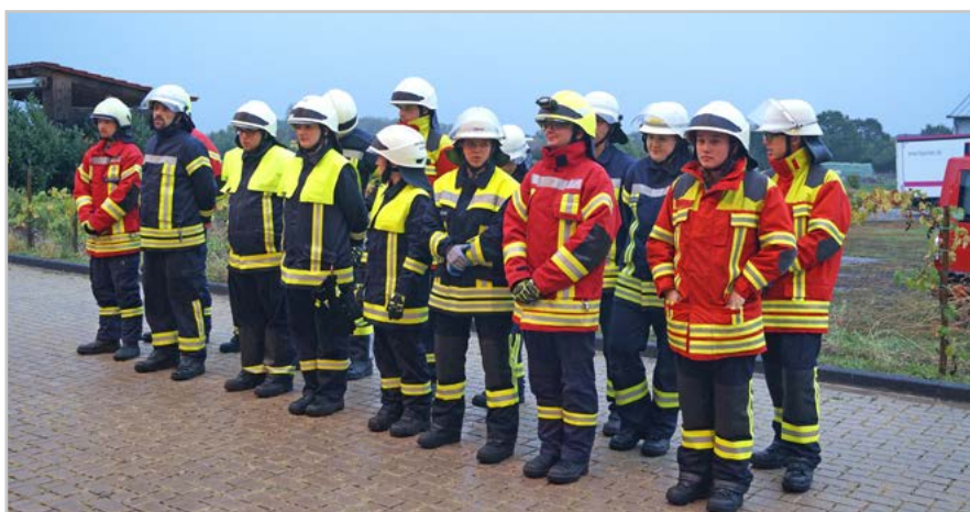
Antreten zur Begrüßung: Teilnehmerinnen und Teilnehmer des Truppmann-I-Lehrgangs.

Über insgesamt sieben Wochen stellten sich die Teilnehmerinnen und Teilnehmer der Herausforderung, zusätzlich zu ihren alltäglichen Pflichten, während der insgesamt 96 Unterrichtsstunden die Grundlagen des Feuerwehrdienstes zu erlernen. Im Rahmen von 22 Unterrichtsstunden wurden zunächst die theoretischen Grundlagen vermittelt. Besonderen Wert legte das Team von Ausbildern hierbei auf die Gefahren an der Einsatzstelle, damit die Teilnehmer sich in ihrem Feuerwehrdienst gut selbst schützen können. In dem Unterricht „Brennen