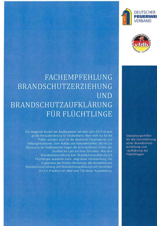
DFV-Fachempfehlung BE/BA für Flüchtlinge