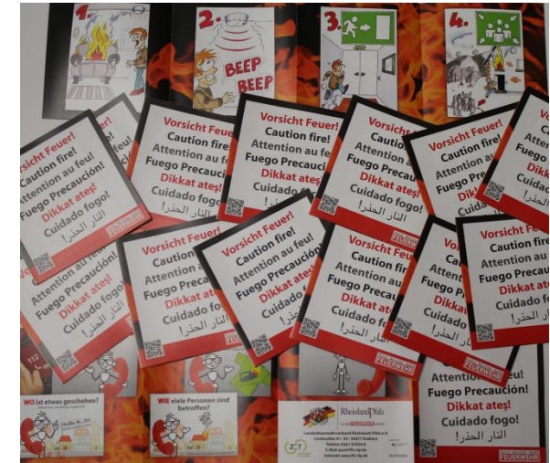
Comic „Verhalten im Brandfall“