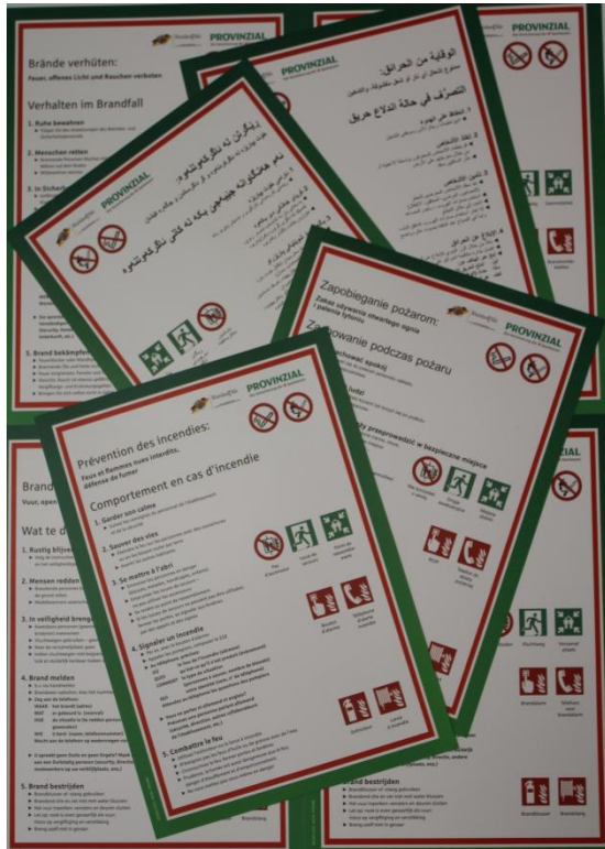
Brandschutzordnung in 19 Sprachen